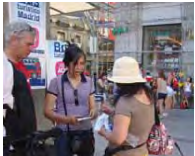
CD's worden uitgedeeld in Madrid