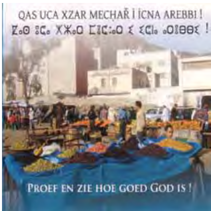
DVD voor Marokkanen