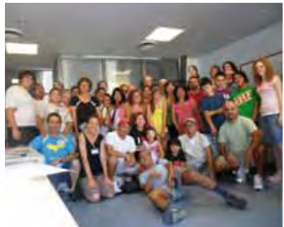
Het complete team dat hielp in Madrid

Vanaf het begin werden onze verwachtingen overtroffen. Gelukkig maakte onze CD-leverancier per ongeluk 5000 teveel Spaanse CD's getiteld "Verlangen naar God". Hierdoor hadden we extra materiaal om uit te delen. Na de eerste dag waren bijna alle Engelse CD's op! We moesten de multicopier uit Ciudad Real naar Madrid laten brengen om meer CD's te kunnen maken. De laatste drie dagen en nachten van de campagne hebben mensen elkaar afgelost om 5.600 extra CD's te maken. De meest gevraagde talen waren behalve Spaans ook Engels, Italiaans, Portugees, Duits en Frans. Bidt u mee voor hen die CD's ontvangen hebben en voor hen met wie we fijne diepgaande gesprekken hebben gehad?