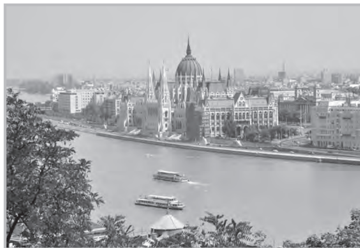
Budapest, capitale de la Hongrie, sur le Danube