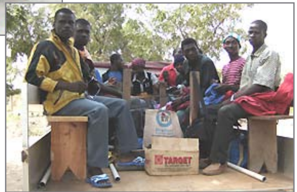
Bereit für einen Evangelisationseinsatz.

Der mitgebrachte Generator war von schlechter Qualität und ging schon am ersten Tag in Brüche. Dagegen hatte ich in der Schweiz einen Honda-Generator, der angeblich defekt war, zum Entsorgen erhalten. Den hatte ich nach Benin geschickt. Nach einer gründlichen Reinigung des Tanks und einer Revision funktionierte dieser sehr gut. Der HERR ist wunderbar! Der Bibelschuldirektor und sein Vertreter führen zusammen mit den Schülern und dem Kleinlas-