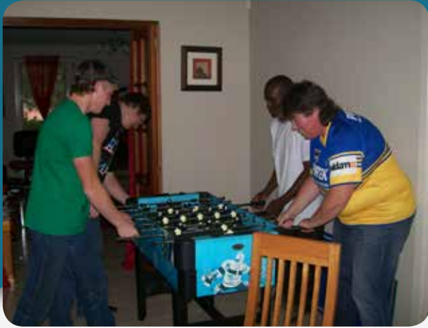
Waktu luang untuk bermain