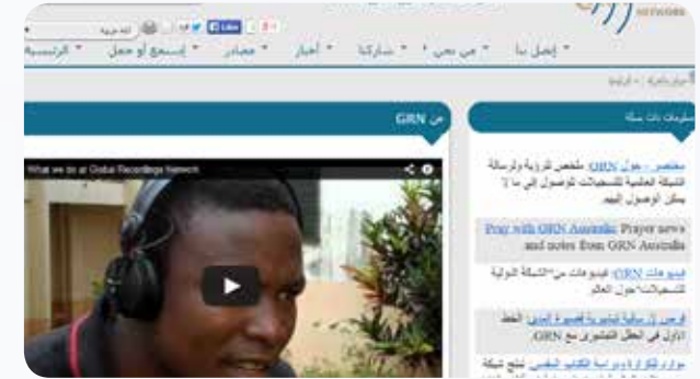
Website snapshot, Arabic version

Para volunteer baru saja selesai menterjemahkan situs kami ke bahasa Spanyol & Arab. Ini berarti mereka yang berbahasa Spanyol & Arab kini dapat mengakses