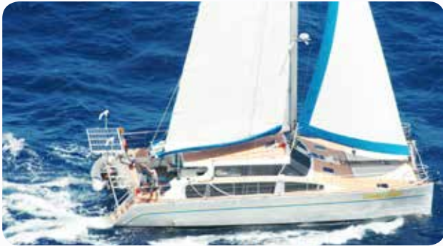
The Dillons' Catamaran

Mereka menghadapi tantangan yang cukup besar