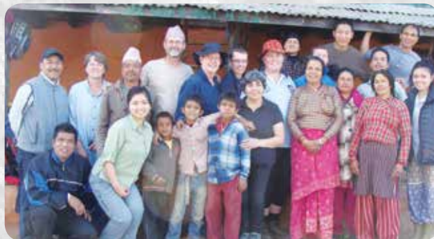
penduduk setempat mengunjungi kami di hotel

Setelah beberapa jam bekerja keras, kami tiba dirumah satu keluarga lokal yang sangat bergembira menyambut 17 orang tamu dan merayakan Tahun Baru bersama orang percaya setempat. Banyak yang memberi kesaksian tentang pekerjaan Tuhan dalam hidup mereka, hal mana menjadi pendorong semangat. Saya jatuh tertidur sementara mereka kebaktian sepanjang malam.