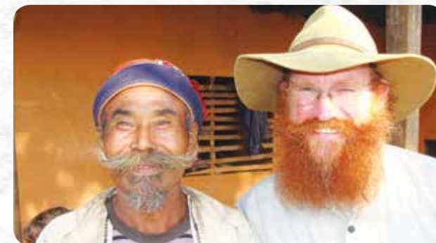
Memiliki suatu kesamaan.

Suatu perjalanan yang berharga dan sangat menyegarkan untuk berbagi gospel kepada orang yang sangat ingin dan tertarik untuk mendengar. Kami berbicara dengan orang-orang dari kasta Brahma yang tidak suka untuk berbicara dengan orang-orang Kristen Nepal, namun mau berbicara dengan orang asing, jadi kami menjangkau mereka yang sulit diinjili oleh orang Kristen setempat. Orang Kristen setempat yang menjadi penterjemah kami sekarang harus kembali dan mengunjungi mereka yang tertarik.