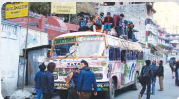
Bis ini 'hampir penuh'

Kemudian tim kami yang terdiri dari 10 orang asing dan 7 orang Nepal meninggalkan kota dengan bis.