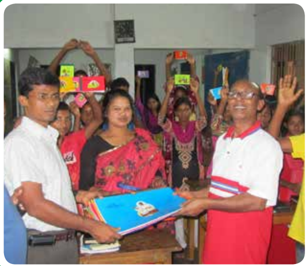
Gereja bersuka menerima material GRN dalam bahasa mereka sendiri