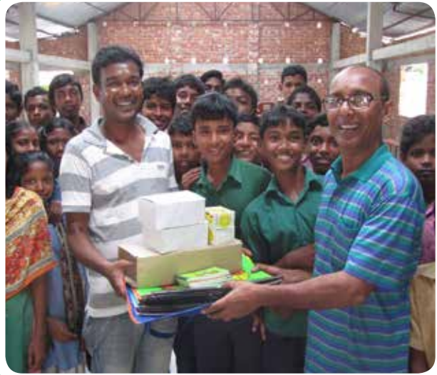
Menyerahkan materi bagi pekerja yang setia agar lebih efektif menjangkau orang dengan Kabar Baik.