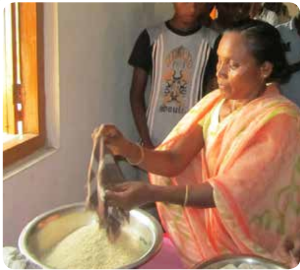
Seorang wanita memberi perpuhan beras di gerejanya